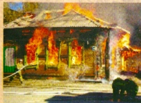
В этом доме в поселке "Уваров" Ангарского района 2 января 2014 г. при пожаре погибли три детей.

• При прибытии пожарных расскажите им о находящемся во дворе баллончик с газом.